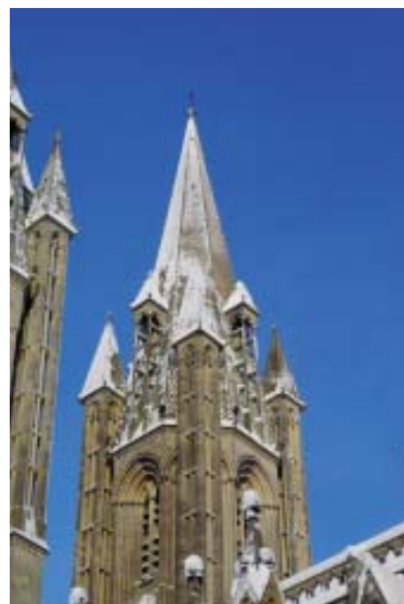
L'hiver avant l'heure, la flèche blanchie de la cathédrale dans l'azur.