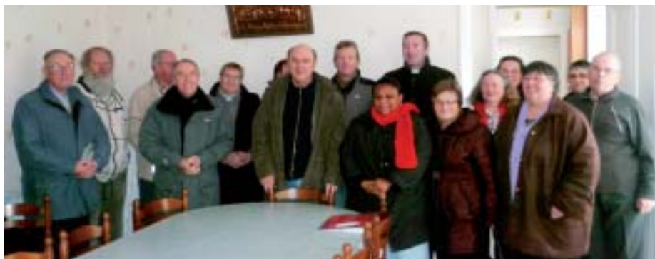
L'équipe d'animation du doyenné.

Il a donc entrepris de passer une dizaine de jours dans chacun des huit doyennés du diocèse. Le Pays Saint-Lois l'a accueilli en octobre, celui du Mortainais en novembre. Chez nous,