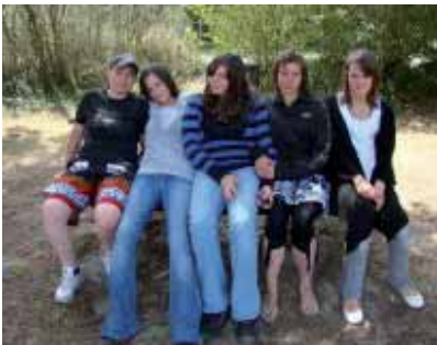
Les participants Coutançais.