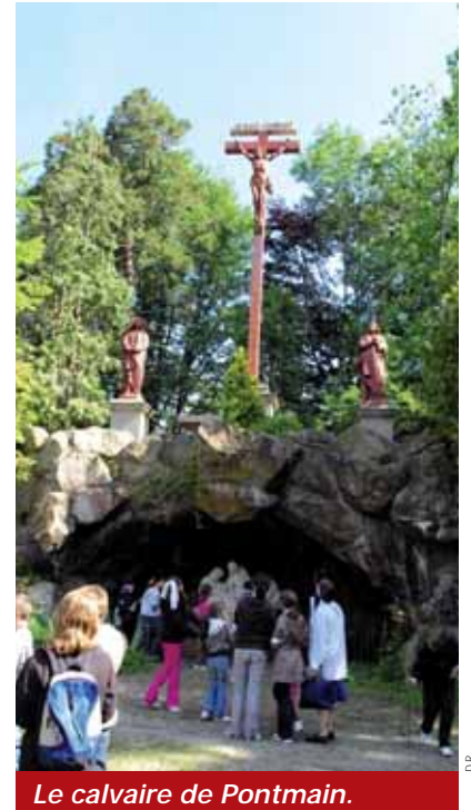
Le calvaire de Pontmain.