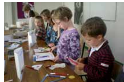
Les enfants au travail.

peinte avec sur chaque pétale une lettre du prénom Marie. Et l'on peut lire aussi le verbe aimer en changeant les pétales de sens.