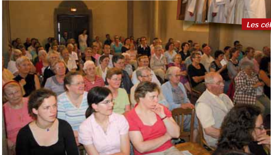
L'assemblée à l'école de la foi.