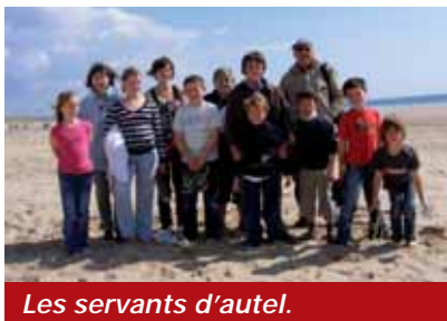
Les servants d'autel.

La matinée a été consacrée au Bienheureux Thomas Hélye. Né