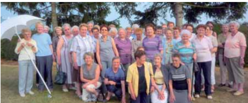
Les participants à la journée Espérance et Vie.

Le mardi 29 juin, les représentants des divers groupes paroissiaux ont mis sur pied les grandes lignes de la journée de rentrée paroissiale. La messe (unique) sera célébrée à 10 h 30 à la Cathédrale et sera suivie d'un pique-nique au CAD (apporté par chacun), puis par un rallye dans Coutances. Le but du rallye est de faire connaître à tous les mouvements et activités de la communauté paroissiale. Retenez donc dès maintenant votre journée du 26 septembre. Et aussi le mardi 24 août, 20 h 30, Maison diocésaine, préparation par ateliers.