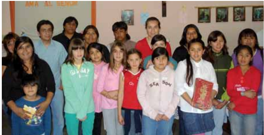
Groupe de catéchèse réunissant parents et enfants.

Dieu. Chacun est invité à commenter et à partager.