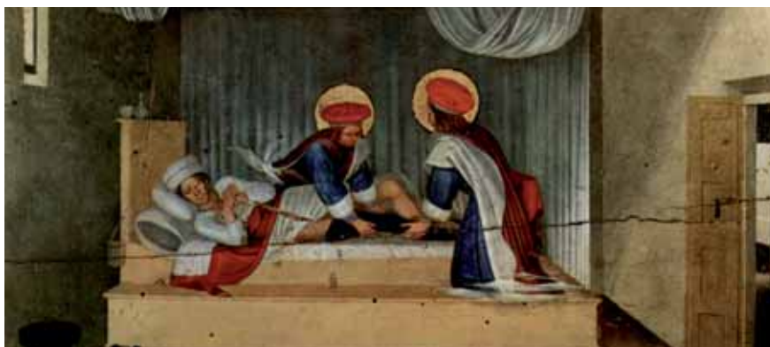
Greffe d'une jambe par les saints Côme et Damien panneau de la prédelle de la Pala di Fra Angelico au couvent San Marco, Florence.

Sans doute frères jumeaux, originaires d'Arabie, Côme et Damien naissent dans une famille chrétienne installée en Asie Mineure. Ils apprennent la médecine et exercent dans la province romaine de Syrie. Soignant et guérissant les maux du corps et de l'âme, ils le font sans recevoir d'argent; nombreux sont ceux qu'ils convertissent à la foi chrétienne.