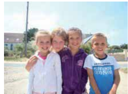
Les participants Coutançais.