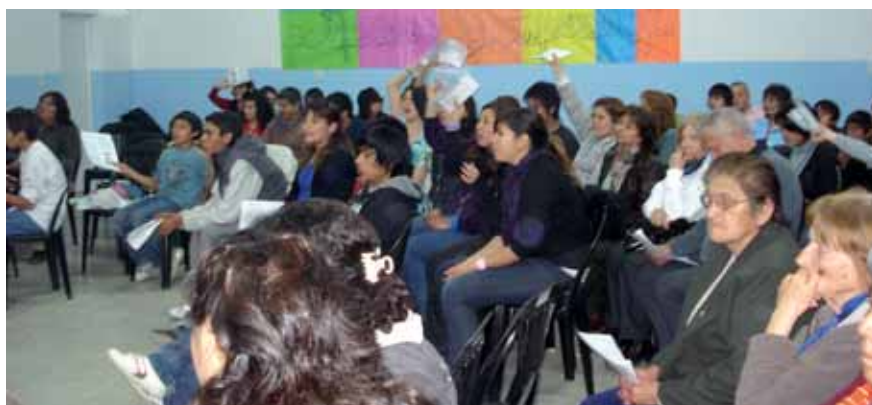
Réunion d'une des communautés.