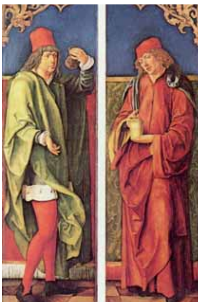
Saints Côme et Damien avec les attributs de leur profession par Hans Süss.