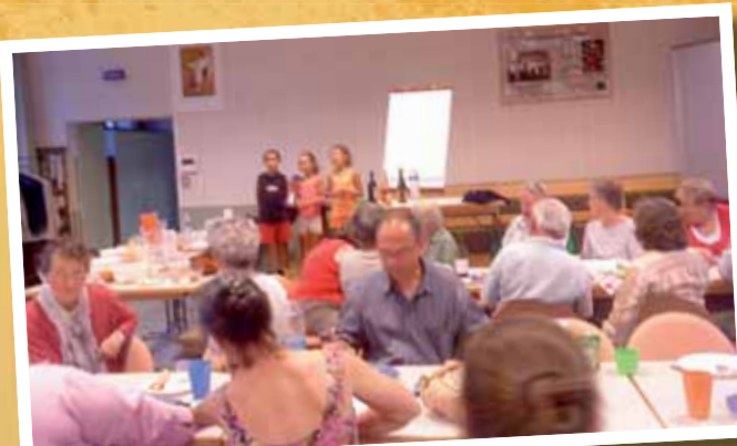
Une partie des convives.

Repas paroissial le 2 juillet à la communauté du Parc