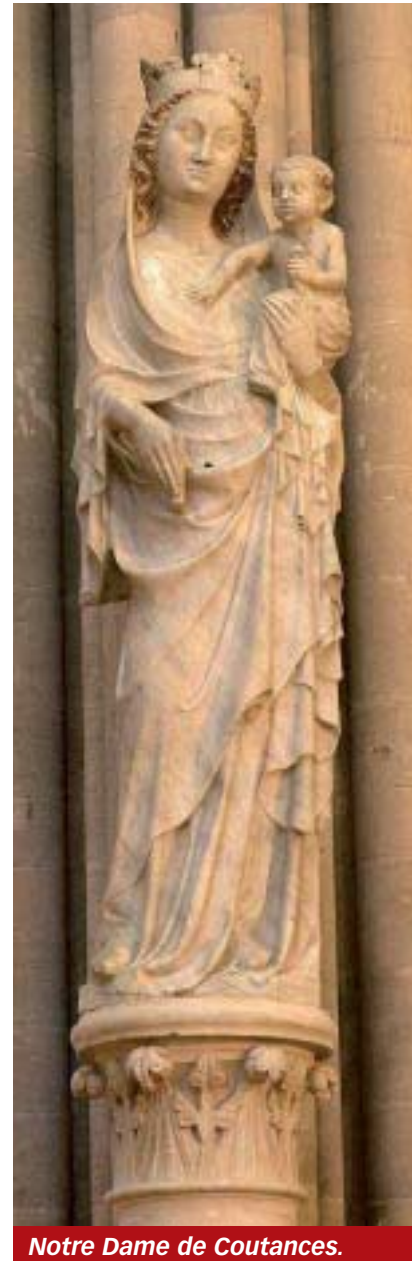
Notre Dame de Coutances.

Ma place est unique, parce que Dieu m'a choisie pour être la mère du Sauveur. C'est par moi que Jésus a reçu son cœur pour aimer les hommes, ses pieds pour marcher sur terre, ses mains pour les clous. Mais ce fils ne m'appartient pas. À la naissance, c'est l'ange de Dieu qui a dicté son nom "Tu l'appelleras Jésus". À sa mort, Jésus m'a donné son disciple comme fils et