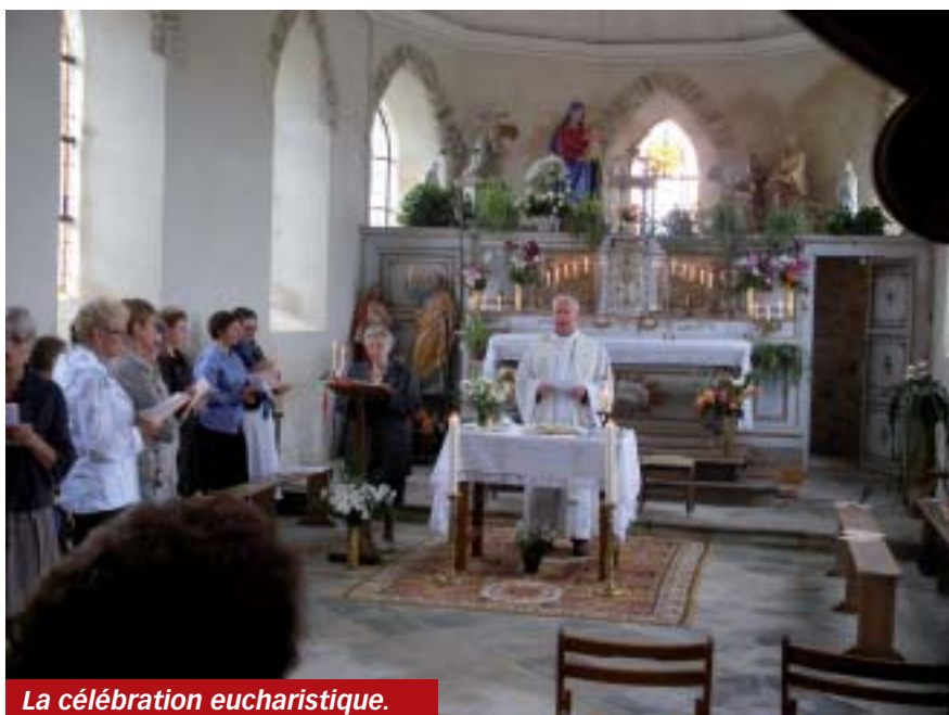
La célébration eucharistique.

L'ASEH remercie les bénévoles organisateurs et les participants à cette fête qui assurent ainsi l'entretien du patrimoine.