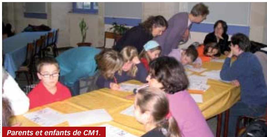
Parents et enfants de CM1.