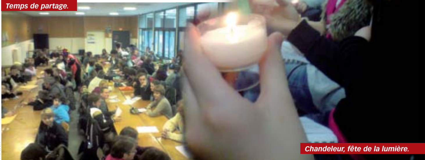
Chandeleur, fête de la lumière.