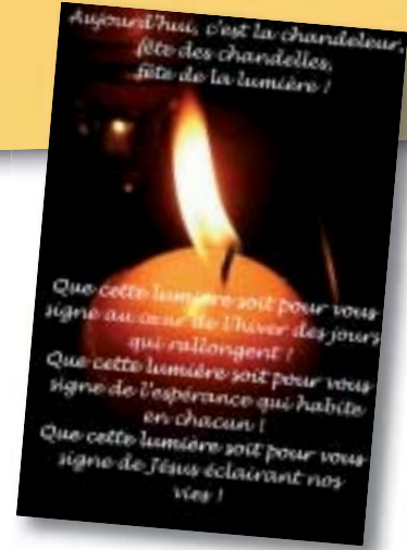
Temps de partage.