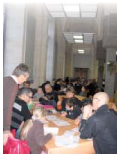
Dimanche d'initiation à Coutances.