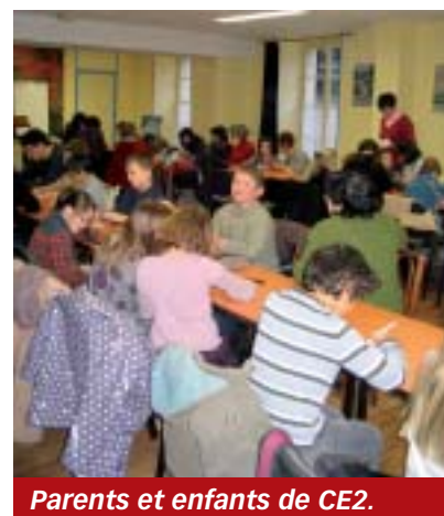
Parents et enfants de CE2.