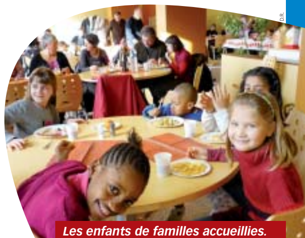
Les enfants de familles accueillies.

L'équipe locale de la Pastorale des migrants