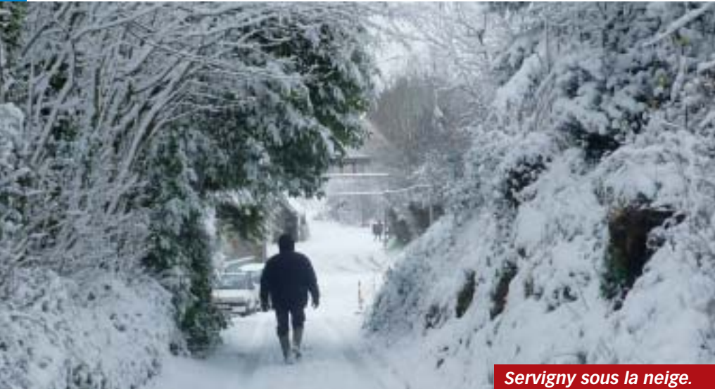
Servigny sous la neige.

L y avait sans doute bien longtemps qu'on n'avait pas vu autant de blanc sur le Coutançais! Du 5 au 12 janvier, les chutes de neige se sont succédées sur la région et, au sol, la couche a rapidement atteint 20, voire 30 cm. Grande était la joie des enfants qui ont vite retrouvé les plaisirs de la luge, des bonshommes et des batailles de boules... Joie aussi pour les adultes qui, le temps d'un week-end, ont pu chausser les skis de fond,