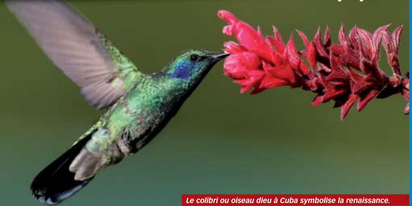
Le colibri ou oiseau dieu à Cuba symbolise la renaissance.