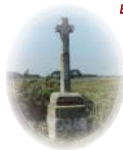
Une croix dans nos campagnes.