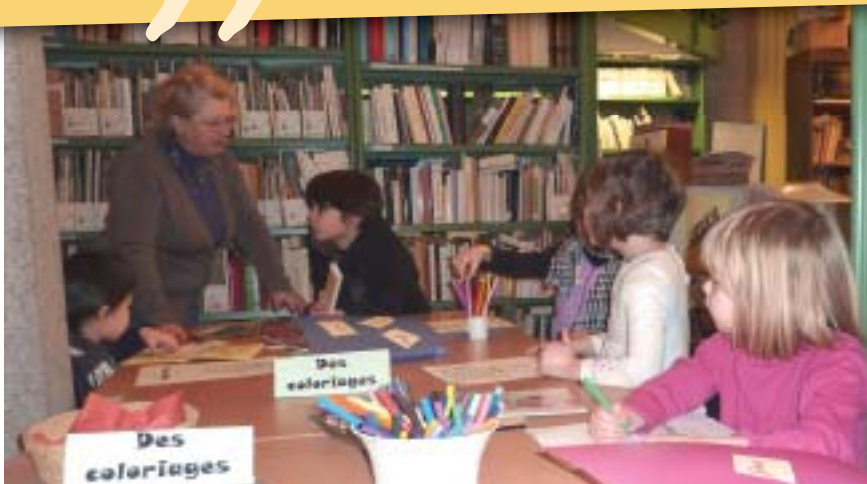
Récréa'bible à la bibliothèque diocésaine.

C'est avec plaisir que la petite dizaine d'enfants présents s'est installée confortablement sur des coussins dans ce jardin de Pâques. Assis, ils ont écouté Sophie lire le livre joliment illustré de Lois Rock, Pâques, Jésus est vivant , ou celui de Géraldine Elschner intitulé J'attendrai Pâques qui raconte l'histoire de ce petit poussin qui ne veut naître qu'à Pâques! Des coloriages de lapins, poules et autres œufs pour les plus petits et des jeux de texte à trous, mots mêlés, puzzle, mots croisés et des coloriages inspirés des récits pour les plus grands firent la joie des enfants aidés par leurs parents