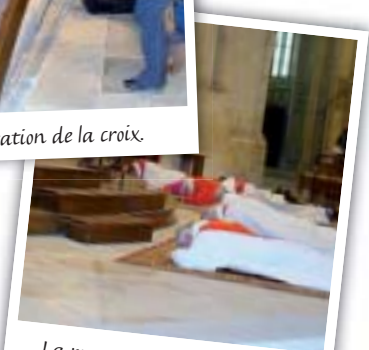
La prostration des célébrants.