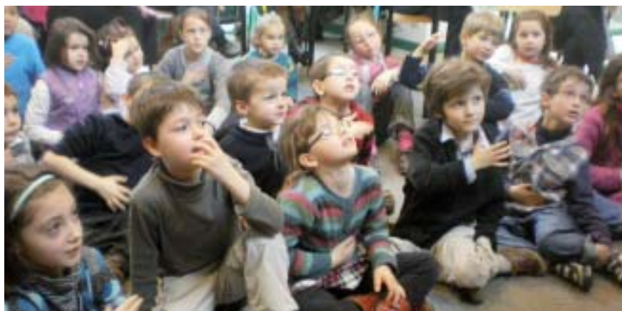
Les enfants écoutant le récit de la Passion.