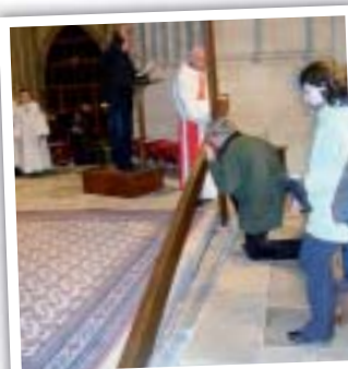
La vénération de la croix.