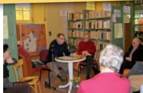
Thé au logis à la bibliothèque diocésaine.

L'heure étant urgente, il faut sortir en plein vent. Des jeunes s'engagent parce qu'ils expérimentent dans une communauté chrétienne la joie profonde à révéler le seigneur à ceux qui ne le