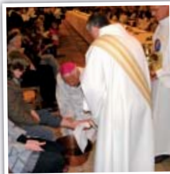
Le lavement des pieds.