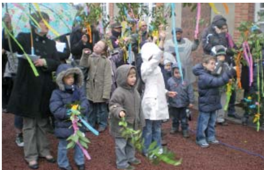
Avec les enfants, la bénédiction des Rameaux.