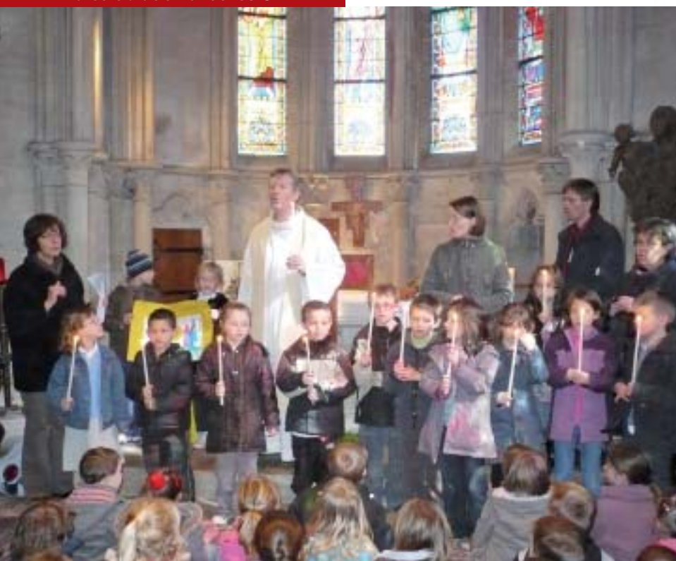
La célébration avec les CP.