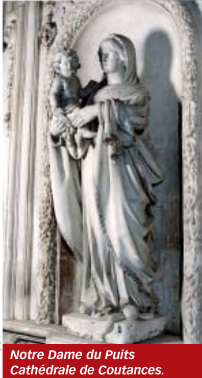
DR Notre Dame du Puits Cathédrale de Coutances.

attentive aux autres : “Ils n’ont plus de vin.” Sans se laisser déconcerter par la réponse déroutante de son Fils, elle parle avec assurance aux serviteurs : “Faites tout ce qu’il vous dira.” Et s’accomplit le premier miracle qui révèle l’intérêt du Seigneur au quotidien de notre vie et la puissance d’intercession de sa Mère.