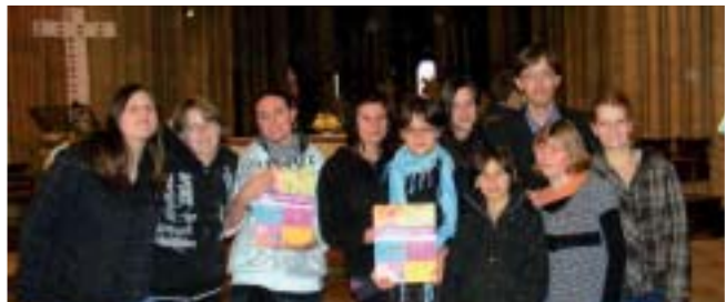
Vente de calendriers par l'ACE le dimanche 17 octobre.