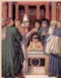
Saint Ambroise baptise Augustin

Né à Trèves vers 340, Ambroise fait ses études à Rome et devient avocat. Puis il est nommé gouverneur de la province de Milan.