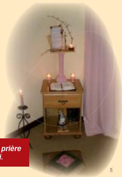
Un coin prière chez soi.

Pourquoi aussi ne pas décider chez soi d'un "coin prière" ?